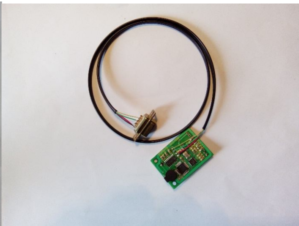
Sl. 2 OEM verzija RFID čitača